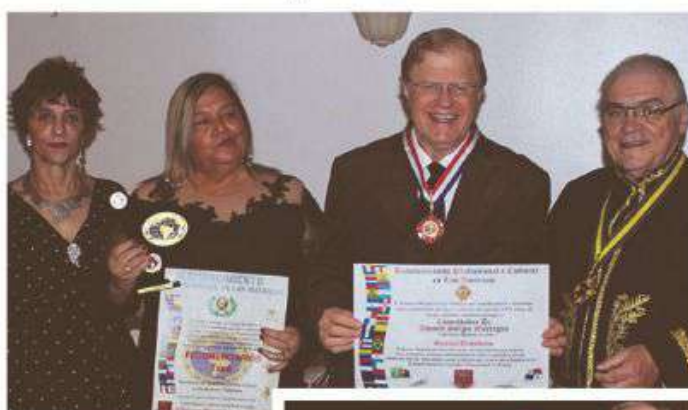
Ao longo de seus 60 anos de história, o Sincomerciários Tupã recebeu uma série de prêmios pela excelência de seu trabalho como o de Destaque Sindical das Américas, no Panamá (acima) e na Argentina (dir.), Láurea recebida outras três vezes.

O trabalho realizado pelo Sincomerciários em defesa da nossa categoria é tão abrangente e significativo que, em cinco ocasiões diferentes, a entidade recebeu o prêmio de destaque Sindical das Américas. O prêmio é outorgado por um grupo de especialistas que reúne representantes de mais de 100 universidades da América Latina e do Canadá, além de membros da Câmara de Indústria e Comércio do Mercosul. A primeira premiação veio em 2011, em quando o Sincomerciários foi premiado na cidade de Santiago, capital do